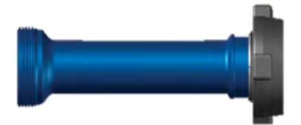
Tubería 602 3"